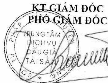
Đoàn Diệu Thúy